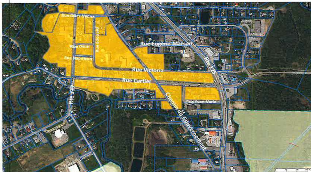
Annexe 1 Règlement 963-17

La carte en annexe 1 du règlement 963-17 est amendée et se lira dorénavant comme suit :